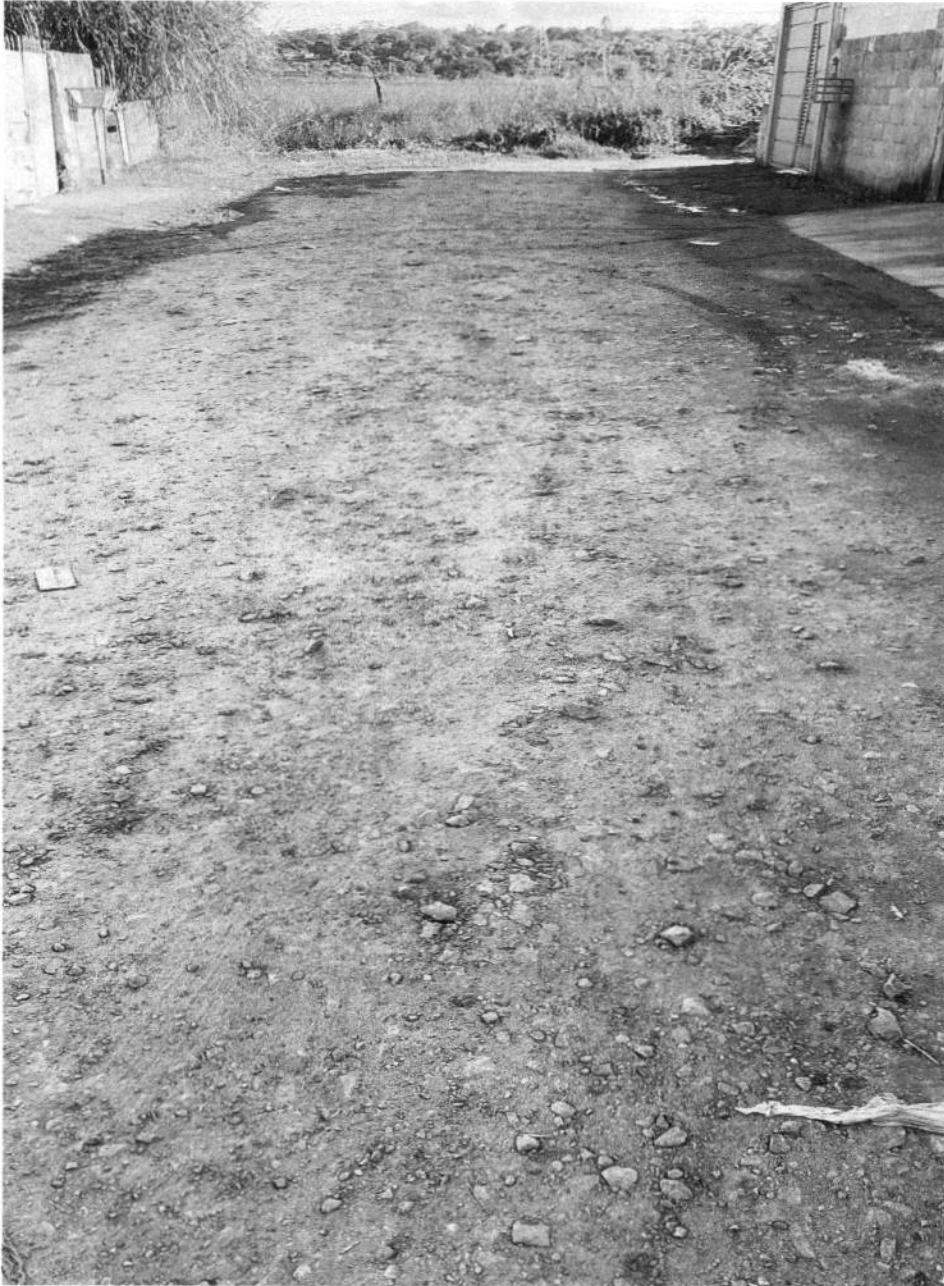
RUA SAMOA JARDIM SANTOS DUMONT II – MOGI DAS CRUZES.